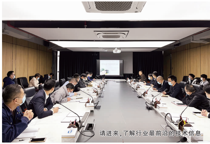
请进来,了解行业最前沿的技术信息

为充实工程技术人员的知识储备,蒙娜丽莎研究院大讲堂采取视频会议的形式向四大生产基