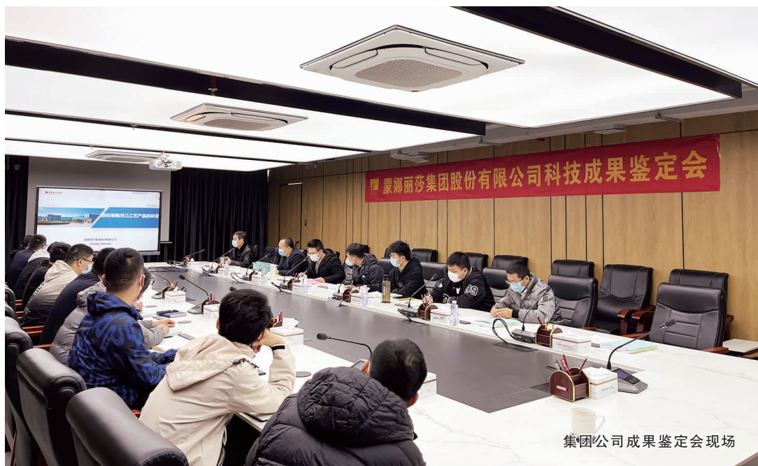
集团公司成果鉴定会现场

12月26日,广东省轻工业联合会在佛山市组织并主持召开了由蒙娜丽莎集团股份有限公司牵