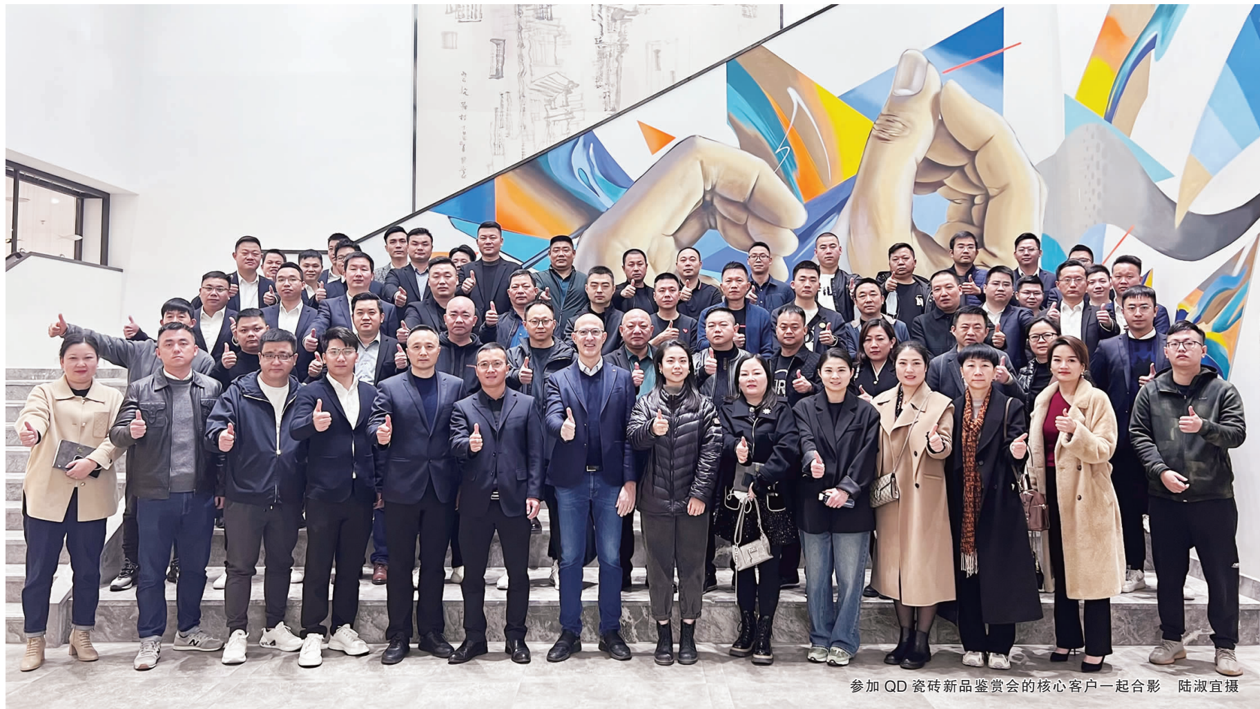
参加 QD 瓷砖新品鉴赏会的核心客户一起合影