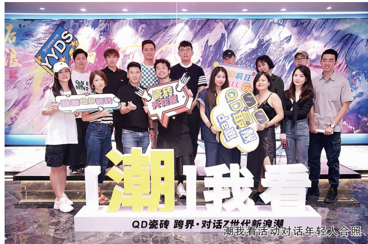
潮我看活动对话年轻人合照

2022年是极不平凡的一年,面对复杂的国内外环境及双减双控的新浪潮,QD瓷砖一路务实奋进,凭借硬核实力实现了品牌破圈发展、品质口碑沉淀、跨界创新营销,放大了品牌传播声量,夯实了品牌文化内涵。 颜值新品 用户导向 QD瓷砖秉承用户导向,不断推陈出新,融汇创新设计、高级质感、出色性能,以及卓越的空间搭配应用。2022年推出了奶油风岩板、原·素系列、奢石系列(暂定)等高颜值、优性能的新品,规格涵盖3600×1800mm、3200×1600mm、2600×900mm、1800×900mm等全品类、全规格的瓷砖产品,产品延伸的同时,给轻时尚家居生活带来了无限可