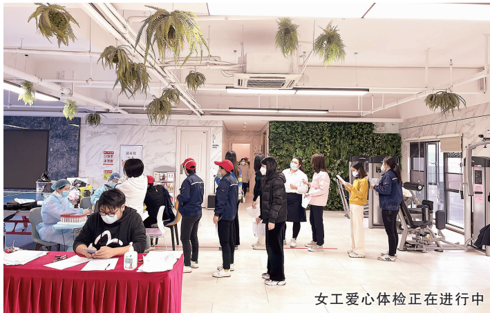
女工爱心体检正在进行中