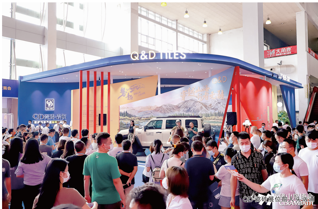
QD瓷砖展位前人头涌动