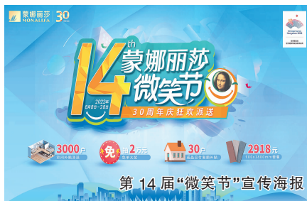
第14届“微笑节”宣传海报