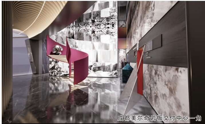
成都美尔奇岩板交付中心一角

粉色旋转楼梯与美尔奇品牌 logo 颜色相呼应,粉红的颜色和螺旋造型,浪漫又吸睛,给前来打卡的来访者营造一个好看又出片的拍照点。另一侧的工艺展示区,