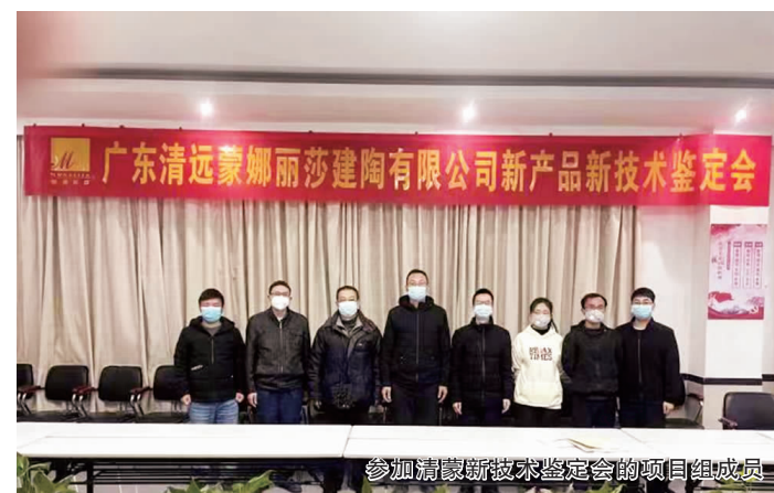
参加清蒙新技术鉴定会的项目组成员

12月27日,广东省建筑材料行业协会、广东陶瓷协会在广州、清远以线上线下方式组织召开鉴定会,对广东清远蒙娜丽莎建陶有限公司、蒙娜丽莎集团股份有限公司、广西蒙娜丽莎新材料有限公司、高安市蒙娜丽莎新材料有限公司共同完成的“超薄布料复合装饰通体瓷质砖研发及产业化”及“仿‘螺钿’装饰艺术陶瓷砖的研发及产业化”进行鉴定。