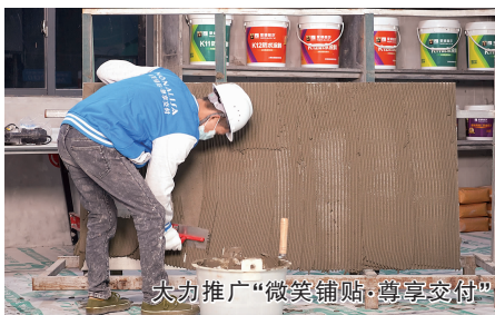
大力推广“微笑铺贴·尊享交付”