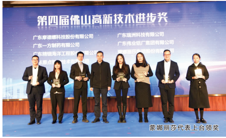
蒙娜丽莎代表上台领奖

蒙娜丽莎“具有远红外及抗菌功能的陶瓷大板研发及产业化”项目,突破性地通过在配方中引入种类众多的微量稀土元素的原