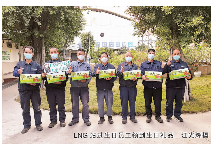
LNG站过生日员工领到生日礼品

蒙娜丽莎集团工会自建工会小组以来,在党建引领下,一直遵循点面结合、齐抓共建、服务覆盖、聚焦需求、集思广益、创新发展等原则,通过“三工联动”的工作模式开展工会小组建设工作。