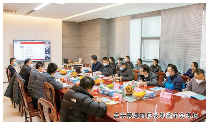
高安蒙娜丽莎成果鉴定会现场