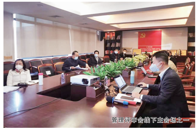
管理评审会线下会场之一