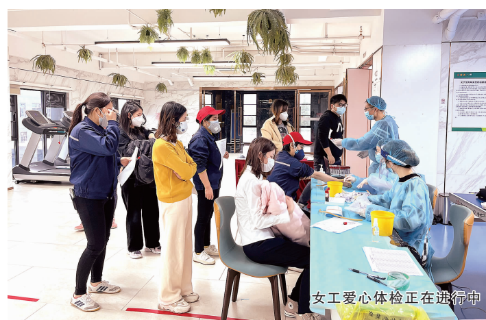
女工爱心体检正在进行中