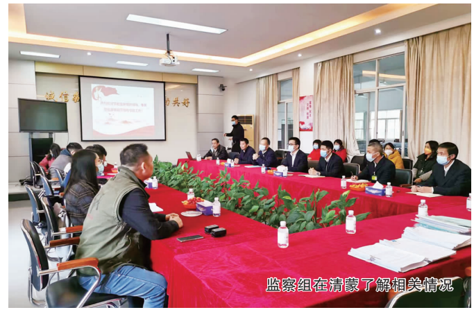
监察组在清蒙了解相关情况